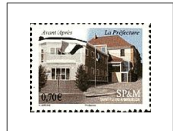
La préfecture Avant / Après