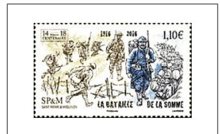
Commémoration de la Bataille de la Somme