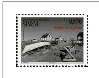
Vestiges de la pêche