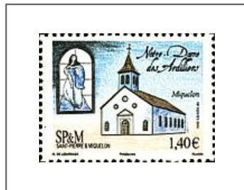
Église N-D des Ardilliers (Miquelon)