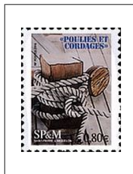
Poulies et cordages : Bitte de pont