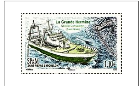
La Grande Hermine